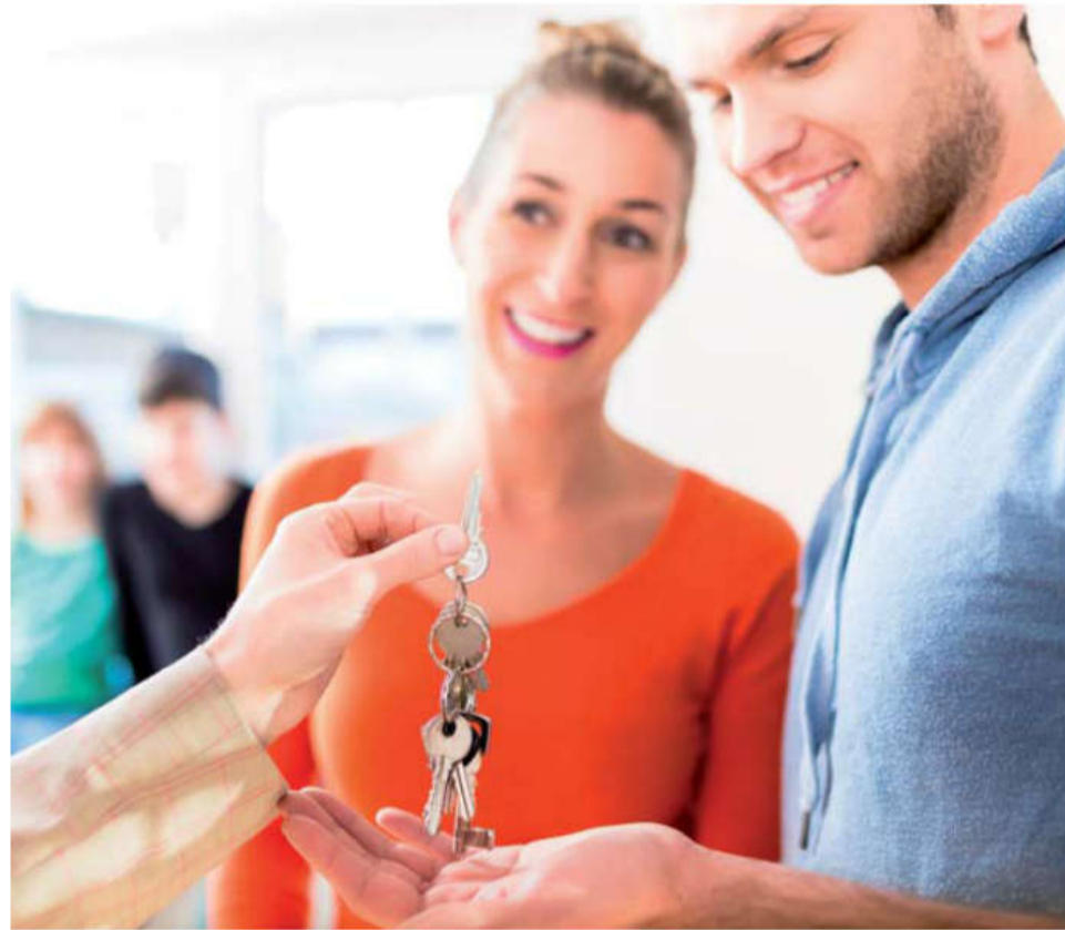
Wohnungsmarkt in Südtirol: 10% der Wohnungen in Südtirol werden nicht dauerhaft bewohnt.

Diese vier Aspekte und Trends waren Ausgangslage der neuen AFI-Studie zur Wohnpolitik in Südtirol. Wohnen 2030 – neue Perspektiven für Südtirols Wohnpolitik. „Wohnen für den Grundwohnbedarf