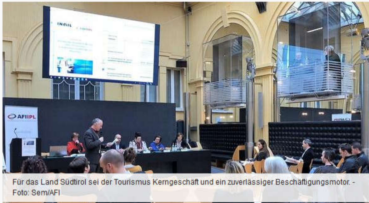
Für das Land Südtirol sei der Tourismus Kerngeschäft und ein zuverlässiger Beschäftigungsmotor.

In der Projektpartnerschaft „Gute Arbeit, Südtirol!“ von dem Arbeitsförderungsinstitut (AFI) und der Gesamtstaatliche Anstalt für Versicherungen gegen Arbeitsunfälle (INAIL) geht es um die Gesundheit der Beschäftigten im Tourismus. Die Frage im dritten Vertiefungsseminar des AFI lautete, was „gesunde Mitarbeiterinnen und Mitarbeiter“ im Gastgewerbe ausmacht, wie betriebliche Maßnahmen praktisch umgesetzt werden können und welchen Nutzen das Gesundheitsmanagement insgesamt bringt.