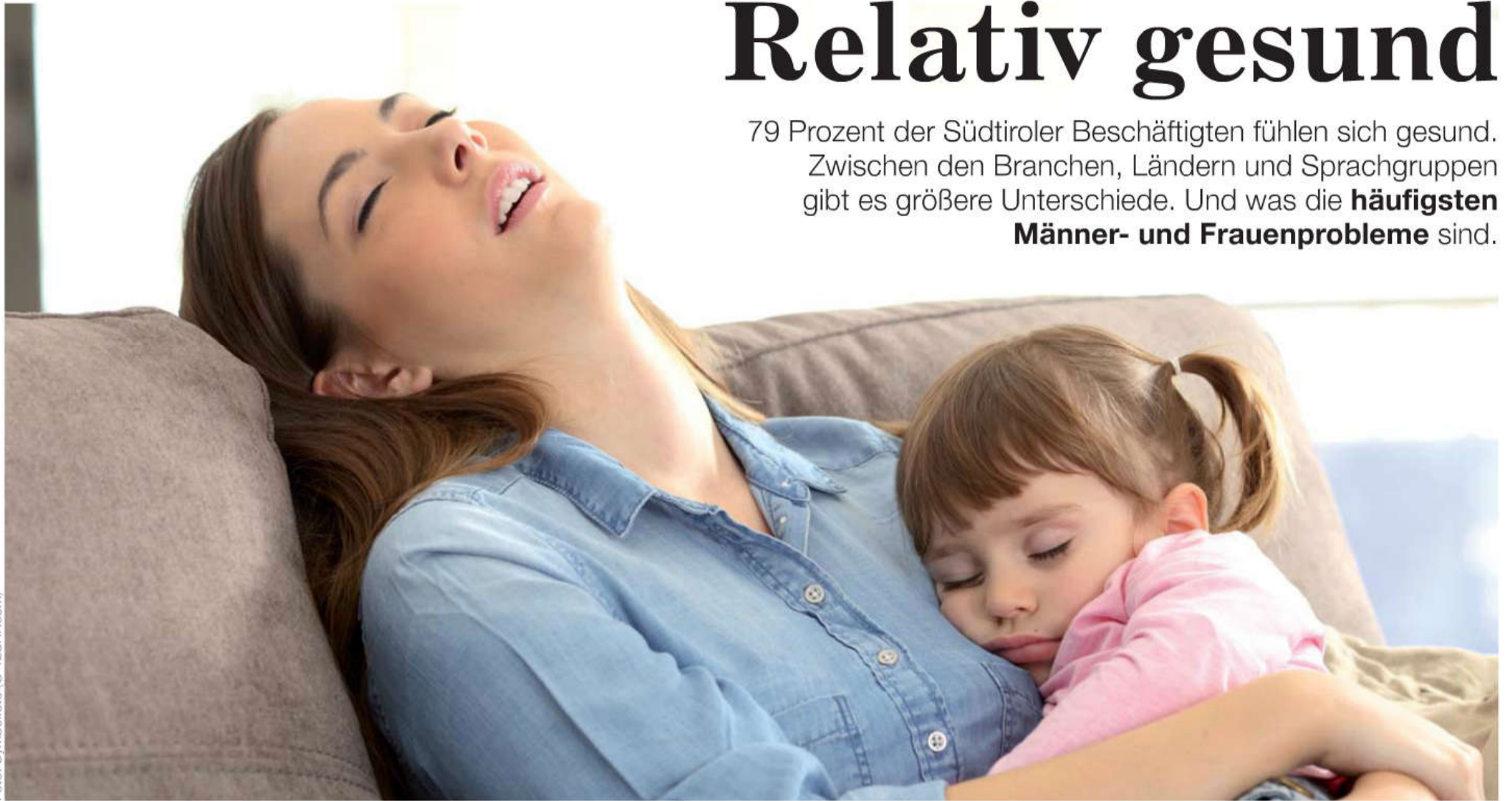
Erschöpfte Mutter: Besonders im Gesundheits- und Sozialwesen intensive psychische und körperliche Belastungen

79 Prozent der Südtiroler Beschäftigten fühlen sich gesund. Zwischen den Branchen, Ländern und Sprachgruppen gibt es größere Unterschiede. Und was die häufigsten Männer- und Frauenprobleme sind.