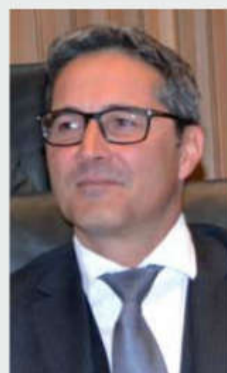
Arno Kompatscher: „Auf Forschung bauen“

Förderliche Rahmenbedingungen und eine gesunde Wirtschaft sind Voraussetzungen für eine gute Arbeitsmarktlage. „Es ist eine unserer