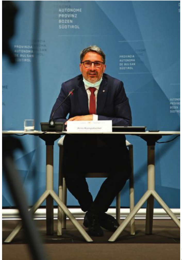
Landeshauptmann Arno Kompatscher hält die Kritik für nicht gerechtfertigt: „Man lässt die vielen grünen und nachhaltigen Projekte bewusst außer acht.“