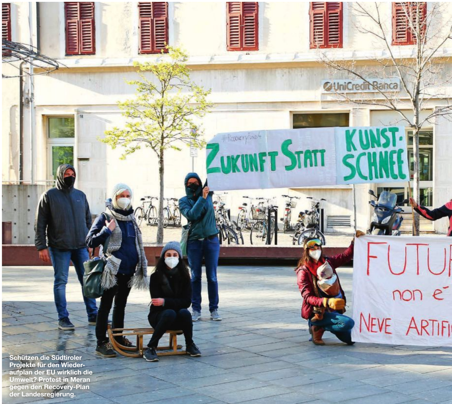
Schützen die Südtiroler Projekte für den Wiederaufplan der EU wirklich die Umwelt? Protest in Meran gegen den Recovery-Plan der Landesregierung.