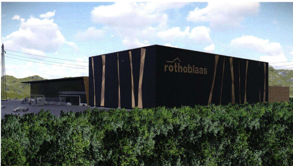
Robert Blaas (links im Bild) ist überzeugt, dass im Homeoffice nur 70 Prozent geleistet wird. 140 der 430 Mitarbeiter sind am Hauptsitz in Kurtatsch tätig (Bild rechts).

Wir werden keine fixe Regelung für das Homeoffice einführen. Wenn individuelle Bedürfnisse da sind, werden die Abteilungsleiter von Fall zu Fall entscheiden, ob dieses Arbeitsmodell infrage kommt. Ich bin überzeugt davon, dass die negativen Seiten überwiegen und dass im Homeoffice nur 70 Prozent geleistet wird, aber auch wir werden in Zukunft etwas flexibler sein. Wir werden auch wieder viel reisen, allerdings überlegter. Vielleicht werden wir es schaffen, die Reisetätigkeiten um 10 Prozent zu reduzieren. Grundsätzlich ist persönlicher Kontakt aber nicht mit Video-Calls zu ersetzen. Ich bin überzeugt: Gute Geschäfte macht man am besten von Angesicht zu Angesicht.