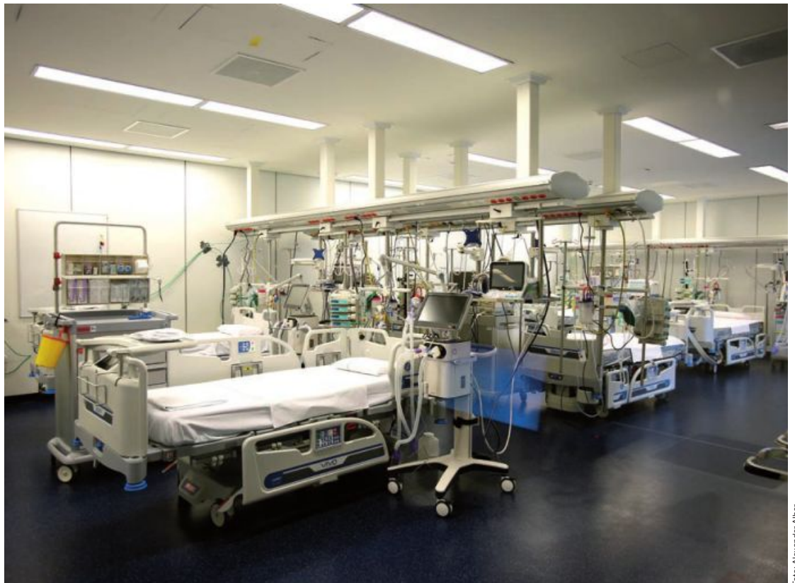
Intensivstation am Bozner Krankenhaus: Geht das Infektionsgeschehen so weiter wie bisher, werden sich die Betten allzu schnell füllen – das System wäre überlastet.