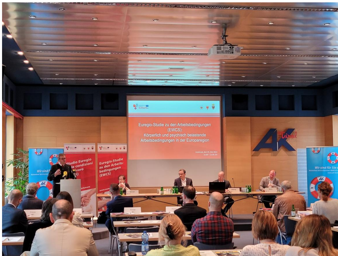
Una fase del convegno di Innsbruck sulle condizioni di lavoro nell'Euregio

Quali sono le condizioni di lavoro in Tirolo, in Alto Adige e in Trentino? Questo è il quesito centrale analizzato nello studio dell'Euregio sulle condizioni di lavoro. Seguendo il modello europeo dell'indagine sulle condizioni di lavoro di Eurofound (EWCS), che si svolge ogni cinque anni in tutta Europa, l'Euregio in collaborazione con gli istituti partner, quali la Camera del lavoro del Tirolo (AK Tirol), l'Istituto Pro-mozione Lavoratori dell'Alto Adige (IPL) e l'Agenzia del lavoro del Trentino, hanno condotto un'indagine completa con 4.500 interviste (1.500 per territorio). Come ha sottolineato il Capitano del Tirolo Günther Platter, Lo studio permette per la prima volta di fare confronti interregionali e di trarre conclusioni sui fattori di localizzazione rilevanti che hanno un'influenza sulle condizioni di lavoro".