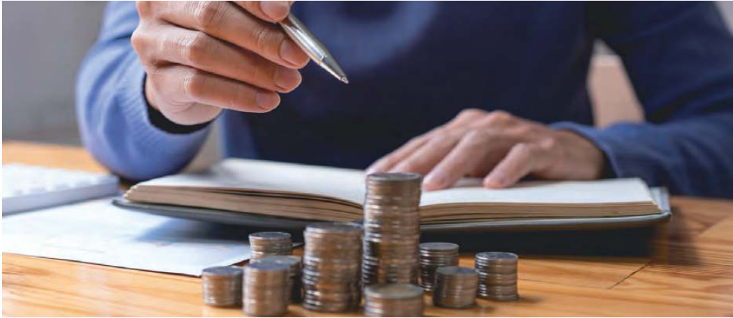
Sparen: Für viele Südtiroler schwieriger geworden

Durch die Pandemie hat sich das Sparverhalten der Südtiroler stark verändert. Das geht aus dem Winterbarometer des AFI hervor. Für viele Südtiroler ist es deutlich schwieriger geworden.