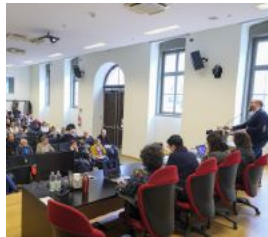
La presentazione «Non è una battuta»

ha ricevuto almeno una volta commenti e battute offensive sul luogo di lavoro. L'1,1% è stata vittima di violenza sessuale. Il 40,9% è stata colpita da commenti sull'aspetto fisico e apprezzamenti indesiderati, il 35,9% ha subito attenzioni sessuali non richieste. Fra le forme di violenza rintracciate dal reportage emergono anche coercizione e ricatto (4%), molestie subdole, talvolta più difficili da identificare. Lo studio è iniziato nel 2021 per indagare quello che succede sui luoghi di lavoro, "spazi complessi" organizzati secondo divisioni gerarchiche e squilibri di potere, che nella loro dimensione relazionale spesso sfociano in episodi di prevaricazione e molestie. Un'indagine quantitativa, portata a termine attraverso la somministrazione di questionari, ma anche qualitativa, con interviste su un campione di 7 testimoni, 3 uomini e 4 donne, che ricoprono ruoli apicali nel sindacato Cgil. L'indagine si inserisce all'interno di un vuoto di ricerca a livello nazionale. In Italia infatti il fenomeno delle molestie non è stato ancora ampiamente indagato, si tratta di ricerche spesso non semplici, complicate dalla mancanza di consapevolezza rispetto a questi temi. Uno studio interessante, dal punto di vista comparativo, è l'indagine europea sulle condizioni di lavoro